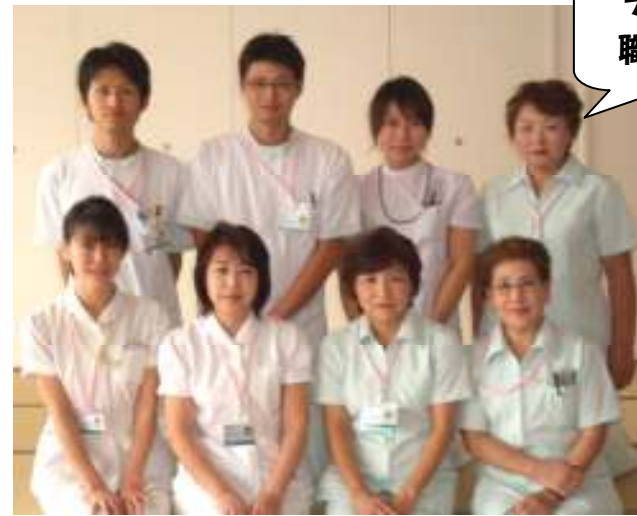
デイケア 職員一同