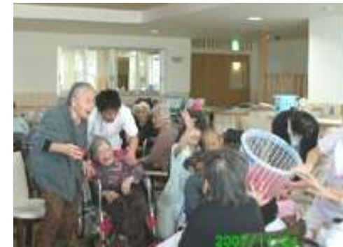
<ある日の集団体操>

この日はチームに分かれて玉入れを行いました。皆さん両手に玉を持ち、元気にカゴを目指し投げ入れていました。