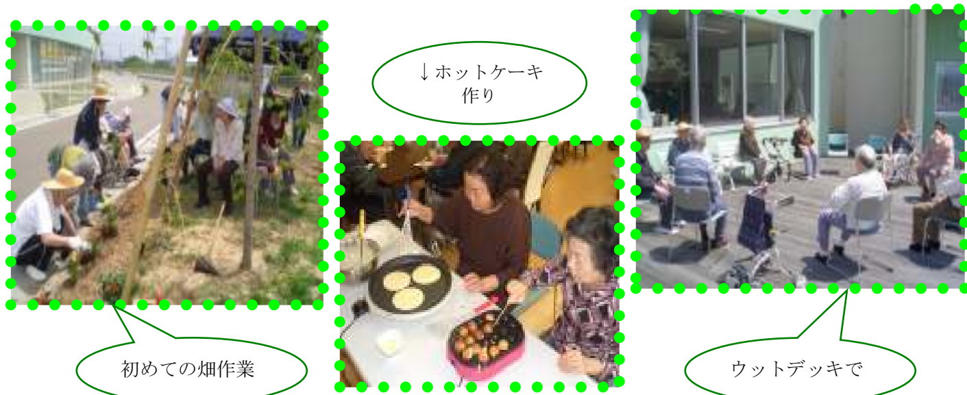
↓ホットケーキ作り

通所リハビリテーションでは、毎月様々な行事を利用者の皆様と楽しんでおります。クッキングや畑仕事、散歩、作品作り、カラオケ、映画鑑賞など、ご希望を取り入れながら楽しく過ごせるよう、お手伝いさせていただいております。畑仕事では、すいかやトマト、枝豆などの苗を植えました。暑い日でしたが、利用者様に教えていただきながら、みんな一丸となって取り組みました。今から秋の収穫祭が楽しみです。