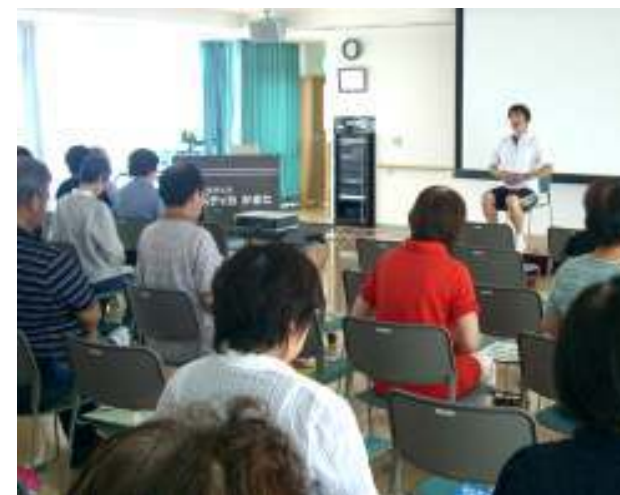
運動の実技を行っている様子です

「こころとからだのセルフケア～気持ちよく息をしていますか?～」をテーマに、ホリスティカかまた4階ハーモニーホールにて健康まつりを開催しました。第1部では、男女の更年期について保健師による健康講話と、健康運動指導士による呼吸法の運動実技を行いました。