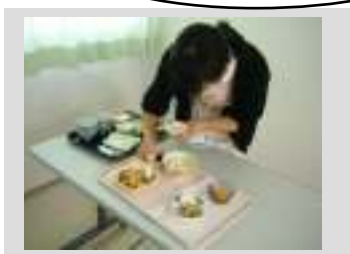
管理栄養士による『介護食の工夫』