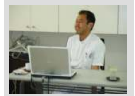
歯科医師による『口腔ケアの必要性』（介護教室）